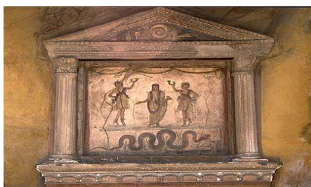
Altar închinat larilor, descoperit la Pompei