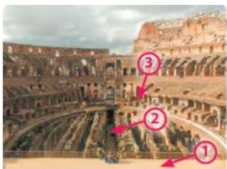
C. Roma – ruinele amfiteatrului Colosseum (interior)