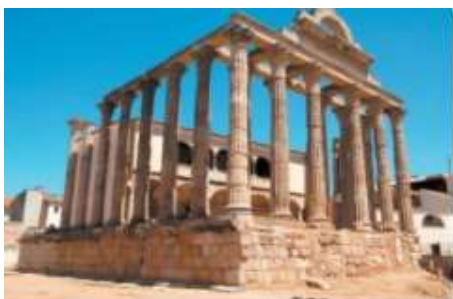
Templul zeiței Diana (Merida, Spania)