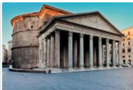
Panteon, templul tuturor zeilor (Roma)